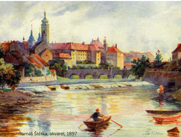
Tomáš Štětka, akvarel, 1897