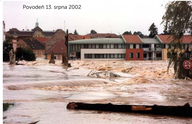
Povodeň 13. srpna 2002