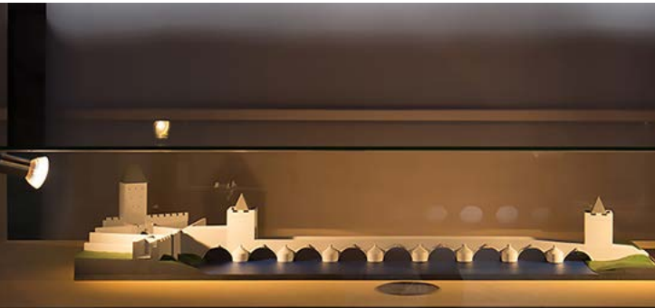
Model Kamenného most s původními věžemi, vlevo Pražská brána při vstupu do města (Prácheňské muzeum)