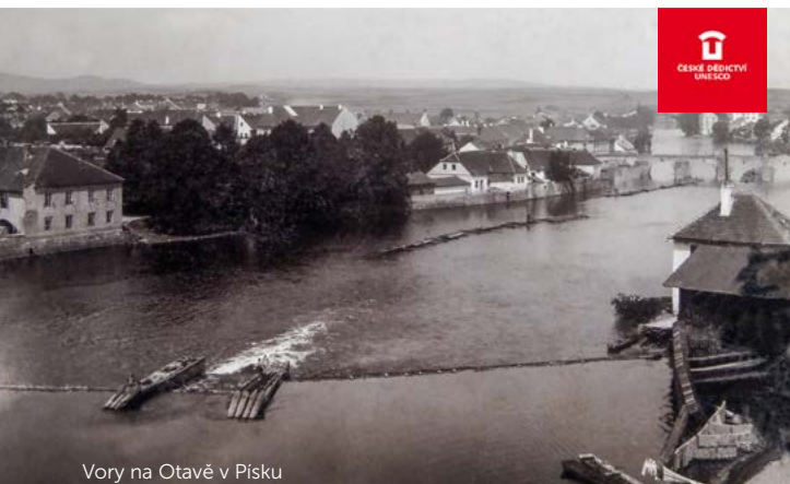
Vory na Otavě v Písku